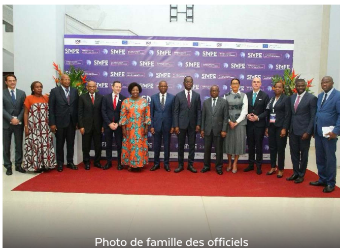
Photo de famille des officiels

Le Sommet s'est achevé par un appel fort en faveur d'une action concertée entre les différentes parties prenantes.