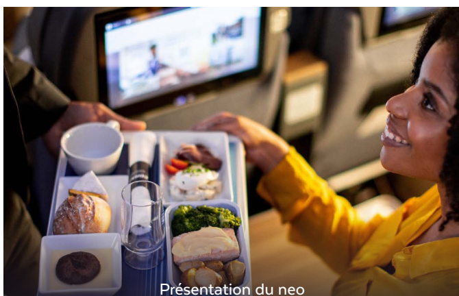
Présentation du neo

Par ailleurs, les possibilités de voyage s'élargissent considérablement car la compagnie propose désormais 09 vols directs par semaine sur la ligne Abidjan-Paris, avec des départs renforcés les jeudis et vendredis. Cette fréquence accrue facilite grandement l'accès aux déplacements professionnels et personnels entre la Côte d'Ivoire et la France. Notons que, les membres ont également la possibilité de bénéficier de cartes de fidélité CORSAIR, offrant des avantages tels que l'accès aux salons d'aéroport, un passage prioritaire lors de l'embarquement, ainsi qu'une livraison prioritaire des bagages.