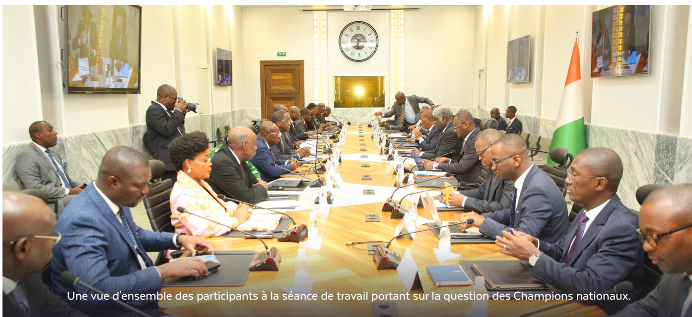
Une vue d'ensemble des participants à la séance de travail portant sur la question des Champions nationaux.