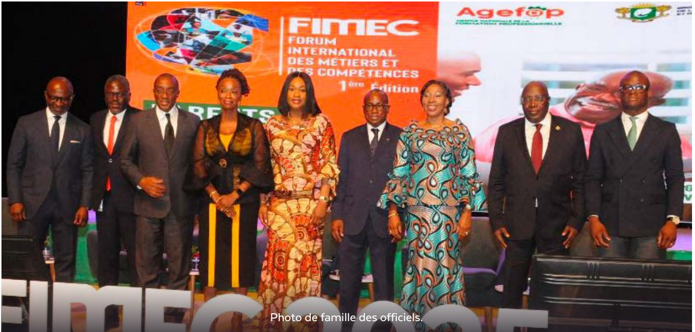
Photo de famille des officiels.