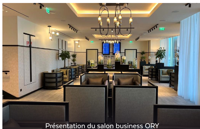
Présentation du salon business ORY