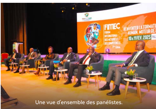
Une vue d'ensemble des panélistes.

Au cours de son intervention, elle a insisté sur l'importance du Secteur privé dans le développement des compétences et l'insertion professionnelle.