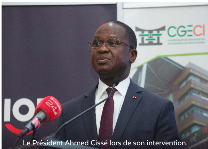
Le Président Ahmed Cissé lors de son intervention.

La capitale économique ivoirienne a mobilisé de nombreux acteurs publics et privés à l'occasion du Sommet mondial sur la formalisation économique, tenu les 05 et 06 février 2025.