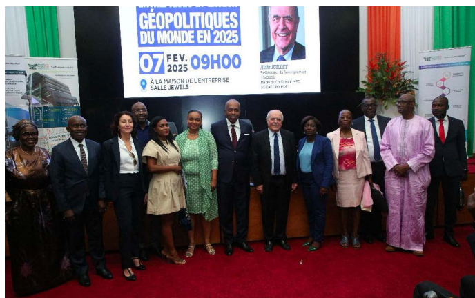
Photo de famille de la Deuxième édition de la Grande Conférence des Administrateurs de Société