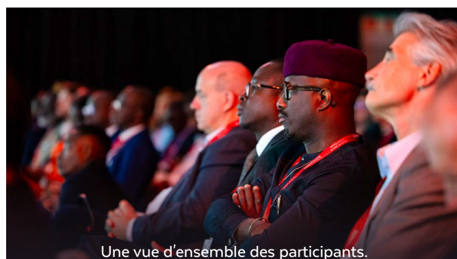
Une vue d'ensemble des participants.