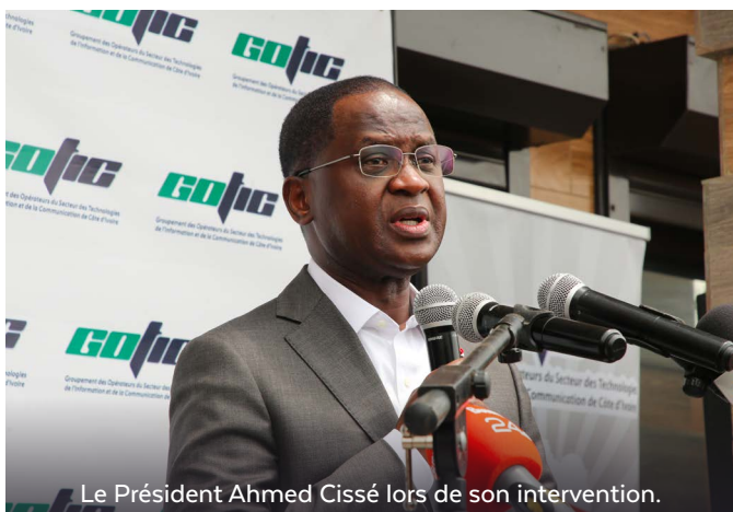
Le Président Ahmed Cissé lors de son intervention.