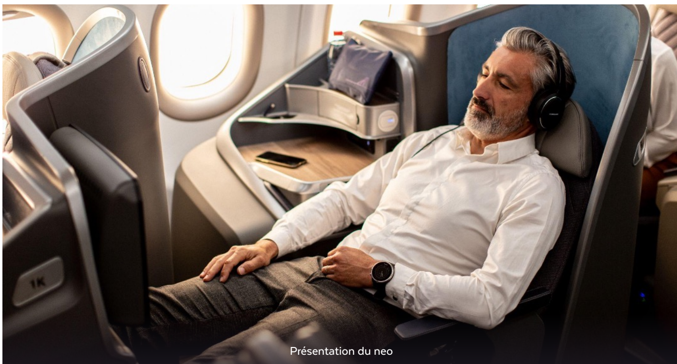
Présentation du neo

Dans un contexte économique où les voyages d'affaires et de loisirs sont devenus essentiels pour le développement des entreprises, la qualité des services de transport y joue un rôle crucial. La Confédération Générale des Entreprises de Côte d'Ivoire (CGECI) qui a bien saisi cette réalité tente d'améliorer les conditions de déplacement de ses membres. De ce fait elle a établi un partenariat prometteur avec la compagnie aérienne CORSAIR. Cette convention vise à offrir des avantages significatifs aux membres, au personnel de la CGECI et à leurs familles respectives.