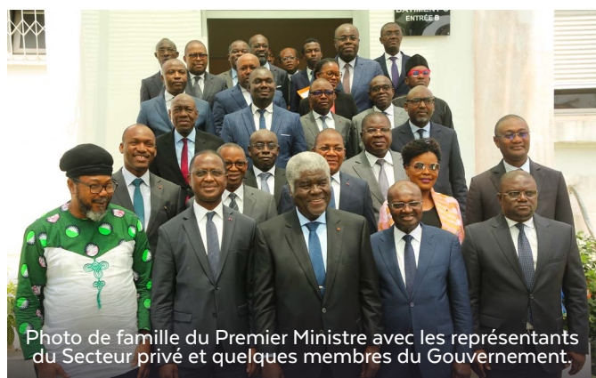
Photo de famille du Premier Ministre avec les représentants du Secteur privé et quelques membres du Gouvernement.

La démarche présentée par le Premier Ministre est inclusive car elle prend en compte les lauréats des Prix nationaux d'Excellence, les opérateurs économiques dans les régions et communes et les jeunes inventeurs.