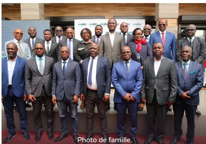
Photo de famille.