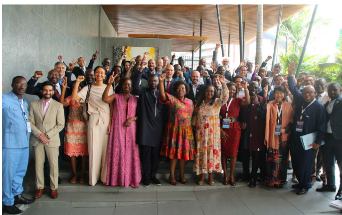
Sommet Mondiale sur la Formalisation Économique : Photo de famille des participants au Groupe de Travail des Employeurs dans le cadre de la préparation à la Conférence Internationale du Travail (CIT)