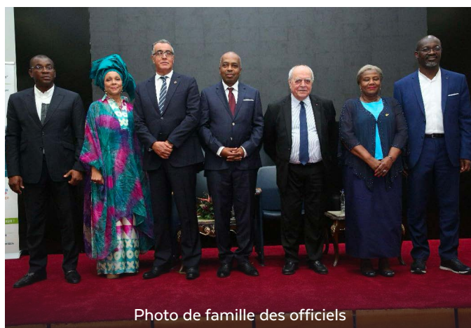
Photo de famille des officiels

La Commission Gouvernance, Éthique et RSE (GERSE) de la CGECI a organisé le 7 février 2025 à la Maison de l'Entreprise, la deuxième édition de la Grande Conférence sur la Gouvernance d'Entreprise autour du thème : « Entreprises et enjeux géopolitiques du monde en 2025 ».