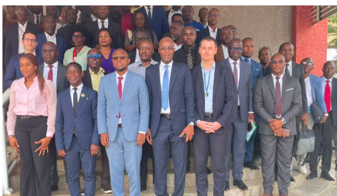
Photo de famille à l'atelier sur le PND 2026-2030 qui s'est tenu à Grand-Bassam avec la participation de la CGECI