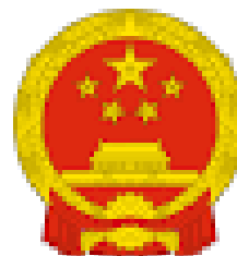
Armoiries de la Chine

Source des informations : Banque Mondiale (BM), International Trade Center, France Diplomatie et Douane Ivoirienne