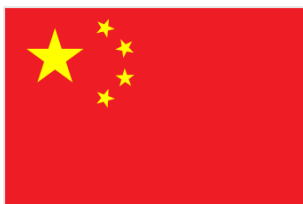
Drapeau de la Chine